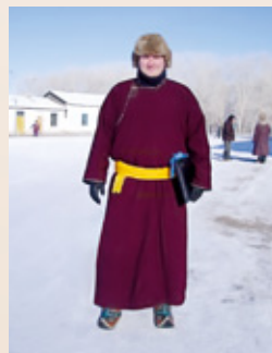
El deel , traje tradicional de Mongolia.