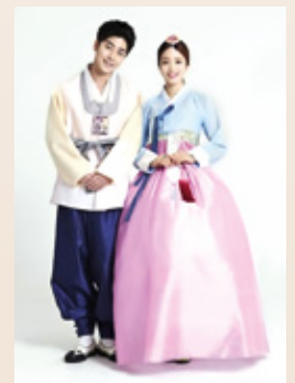
El hanbok , la vestimenta típica de Corea del Sur.